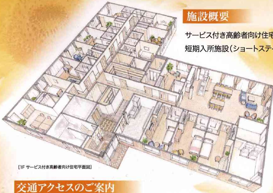
[1F サービス付き高齢者向け住宅平面図]