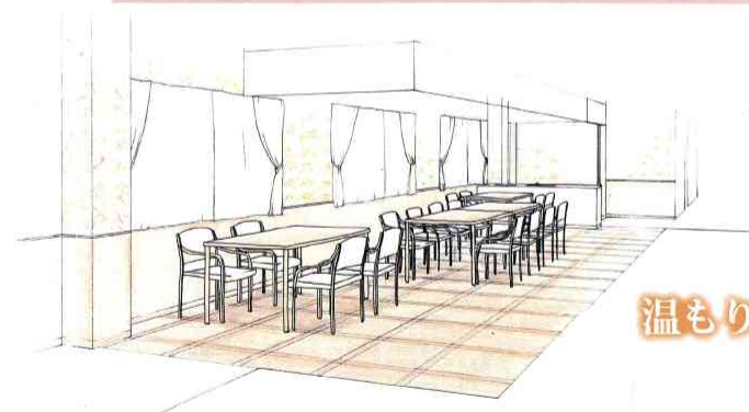
温もりに満ちあふれた生活空間

当施設のスタッフが心を込めて作った、温かく美味しいお食事を提供いたします。カロリー計算をしていますので、健康面にも配慮していて、介護食や糖尿食にも対応しています。